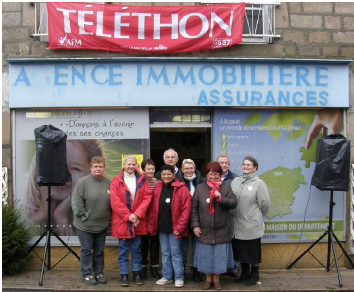
Les bénévoles qui ont œuvré au succès du Téléthon 2008