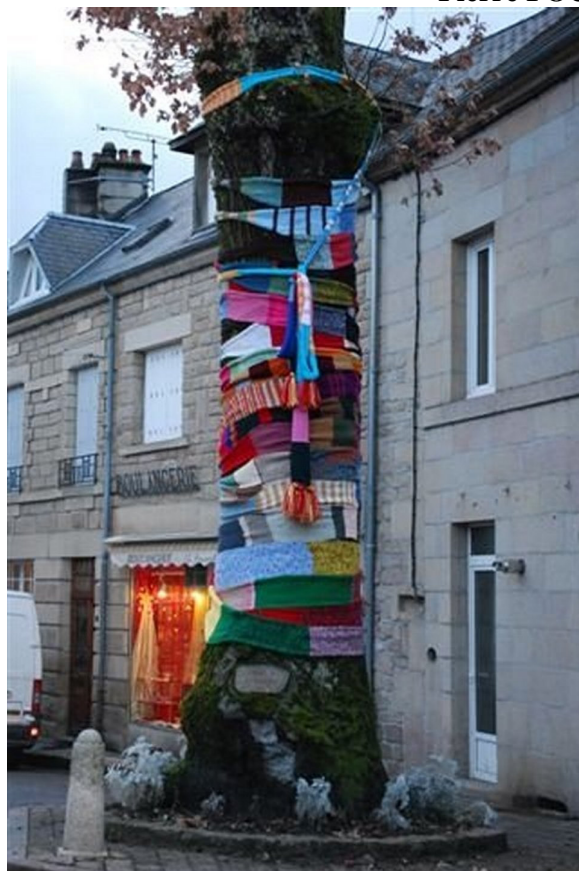
Notre chêne de la Liberté « habillé » pour le Téléthon 2008